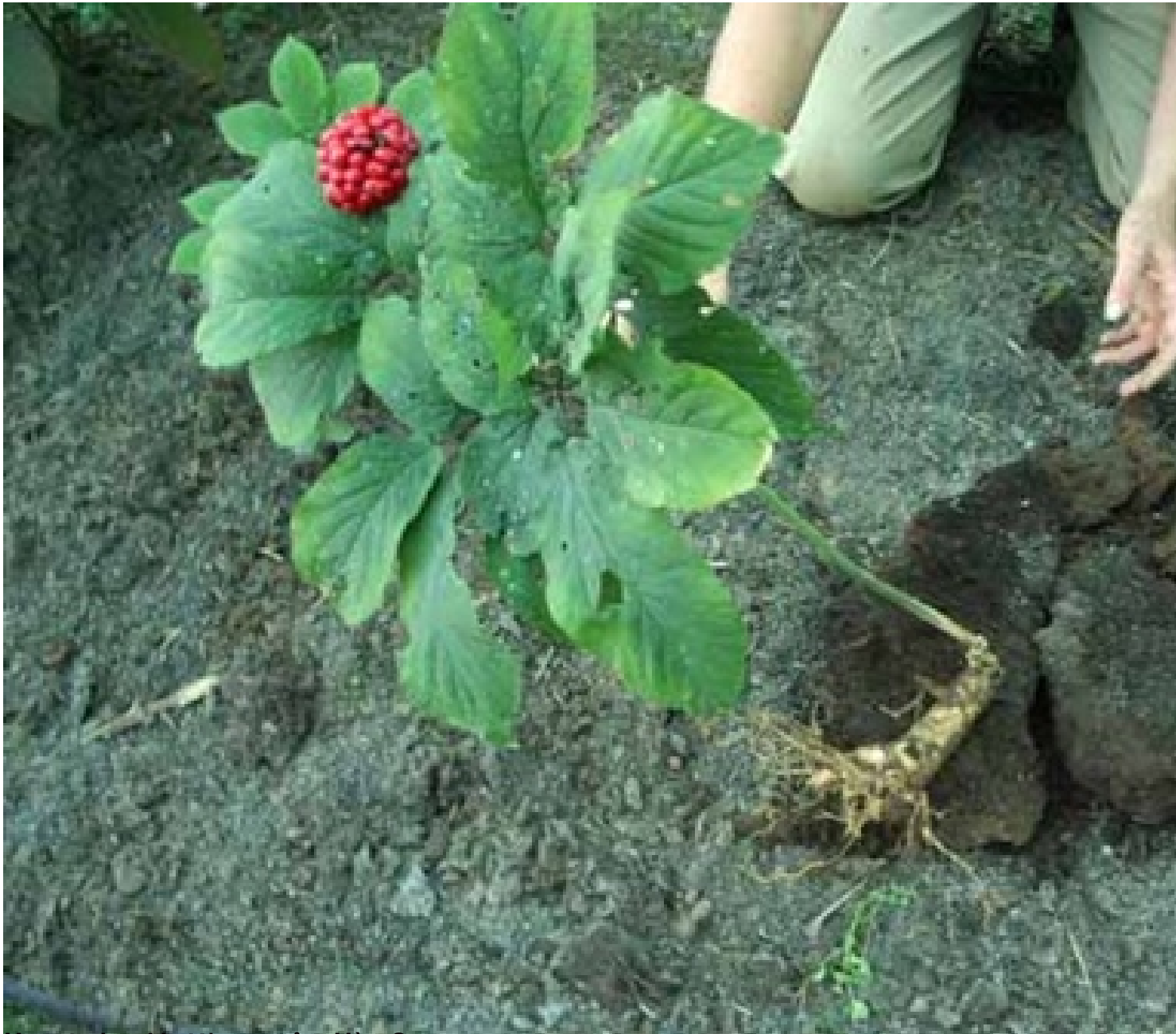
Đông sâm Hàn Quốc (Panax ginseng) là một loại thảo dược quý giá, được trồng và thu hoạch ở Hàn Quốc. Hình ảnh này cho thấy một cây sâm non đang được chăm sóc trong vườn.