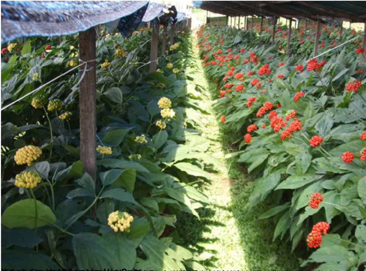
Hồ nông dân gieo trồng sâm Hàn Quốc tại xã Xuân Hòa, huyện Xuân Sơn, tỉnh Phú Thọ, Việt Nam.