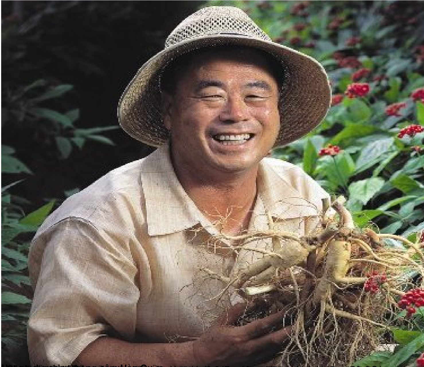
Đ n gieo tr ng sâm Hàn Qu c là một ngành nông nghiệp quan trọng ở vùng núi phía Bắc, đặc biệt là ở các tỉnh như Cao Bằng, Lạng Sơn, Quảng Ninh, và Bắc Kạn. Sản phẩm này không chỉ có giá trị kinh tế cao mà còn là một loại dược liệu quý giá trong y học cổ truyền.