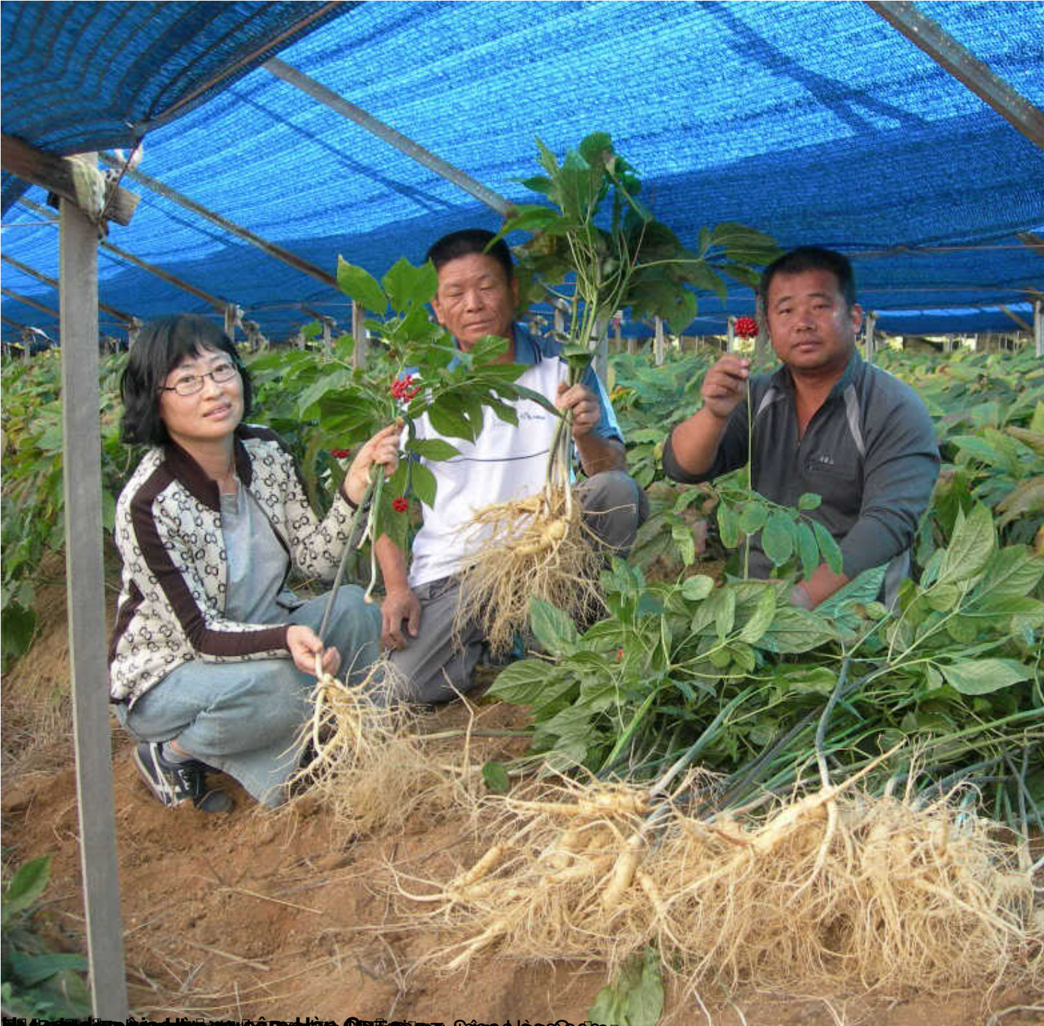
Hồ ng đ n gieo tr ng sâm Hàn Qu c